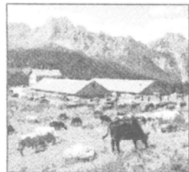
PASCOLO Malga Casera Razzo

La "conquista" è stata frutto di una sinergia tra Provin-