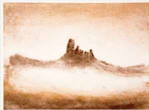
Anton Zoran Music, "Dolomiti", 1975, punta secca, Collezione privata Trieste