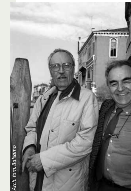
Arch. fam. Balsamo

Il suo estremo individualismo non a caso gli è valso l'accesso all'élite di quei "cinque grandi solitari del XX secolo al pari di Freud, Giacometti, Bacon e Balthus" [1]. La sua opera sembra composta da soli autoritratti dal soggetto vario, una sorta di assolo perenne. Le scene che crea non hanno che lui come unico attore, intento ad un intimo monologo interiore. In quest'ottica è più semplice comprendere la ragione del suo rifiuto di ritrarre altri all'infuori di sé e della moglie: egli riteneva infatti di non poter conoscere nessuno abbastanza a fondo per tale scopo. Balsamo, invece, pare "limitarsi" alla