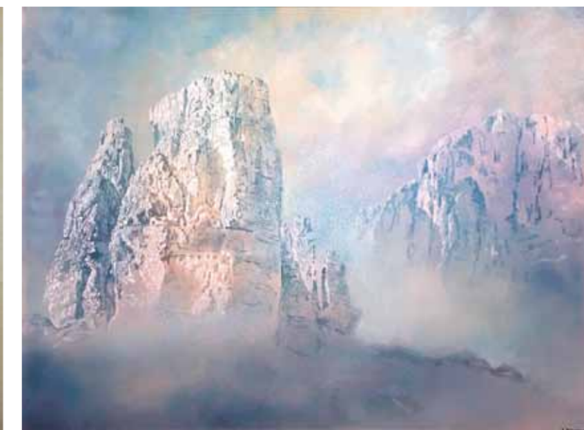
Renato Balsamo, "Cinque Torri - la Torre Grande", 1996 ca, olio su tela, Collezione fam. Balsamo