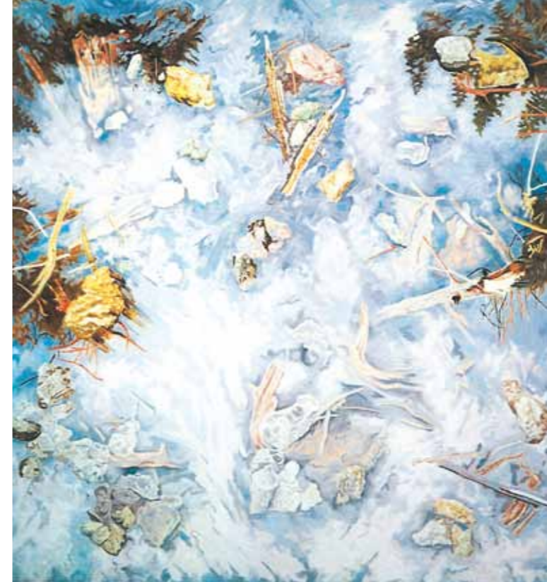
Elio de Zanna, "Espansione", 1971, bozzetto del dipinto realizzato per la Cassa Rurale ed Artigiana di Cortina