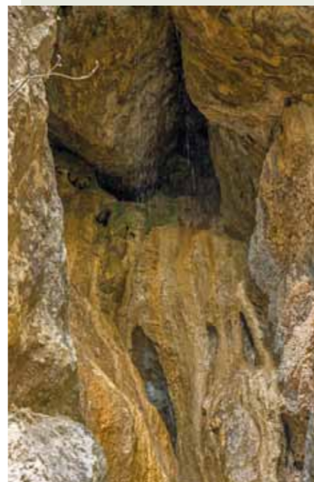
Buš del Capón