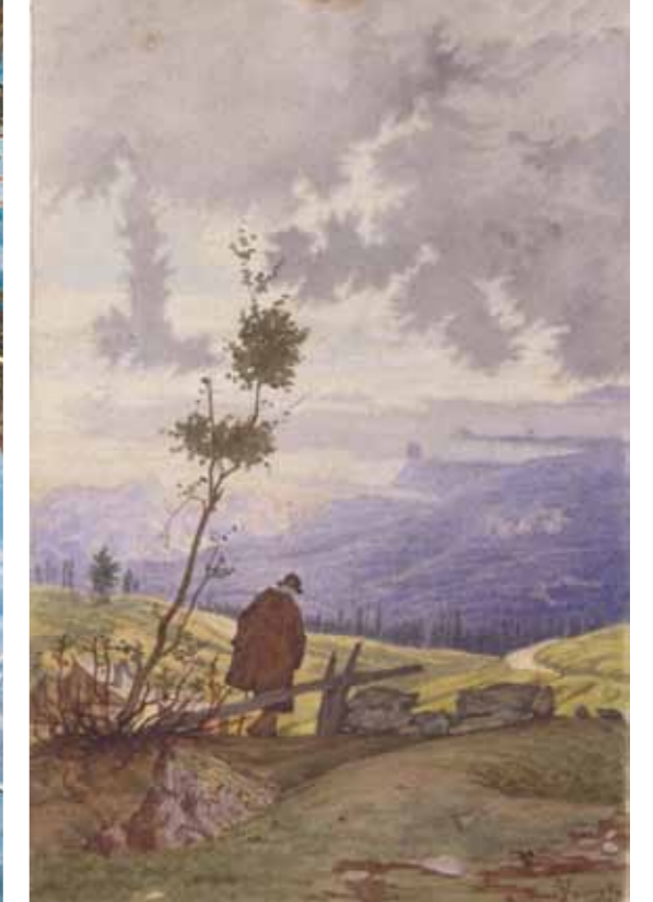
Luigi de Zanna, "Paesaggio di montagna con viandante", 1897, acquarello su carta