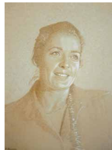
Renato Balsamo, "Mia moglie Mina", 1982, olio su cartone, Collezione fam. Balsamo