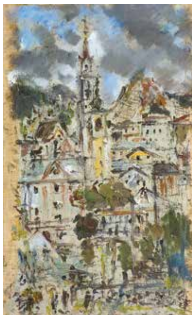
Filippo de Pisis, Cortina, 1937, olio su tela

Mario Rimoldi", organizzata dalla Commissione del Museo Rimoldi in collaborazione con l'arch. Gian Camillo Custozza, si tenne l'evento "Ricordando Filippo de Pisis (1896-1956)", un approfondimento sul percorso formativo, culturale e pittorico dell'artista presieduto dal nipote Filippo Tibertelli de Pisis. La serata faceva parte di un ciclo di incontri nelle città più significative dell'evoluzione e formazione di de Pisis promossi dall'"Associazione per Filippo de Pisis". Per l'occasione vennero esposti anche alcuni dipinti delle collezioni Fracanzani, Cetta e Tibertelli de Pisis, che vennero messi in dialogo con le opere della collezione rimoldiana.