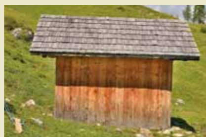
Cason de Son Forcia

presentazione delle stesse, qualora ci siano Regolieri che, non avendo ottenuto l'assegnazione dei casoni sopra segnati, desiderino presentare la loro domanda per Son Forcia. Le nuove domande dovranno essere consegnate agli uffici delle Regole entro il 15 ottobre 2017.