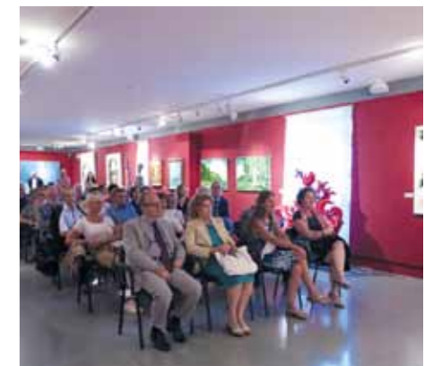
Inaugurazione della mostra "Il Collezionista"

12 agosto: "Collezionisti e collezioni nella storia" con Michele Mirabella. In occasione della mostra Innamorarsi del Contemporaneo. 1941-2017.