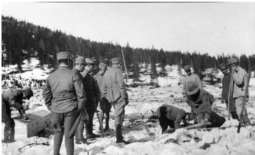
Soldati italiani al recupero salme in località Cianzopé

Di quest'ultima valanga mi raccontò spesso mio nonno: i vecchi di Cortina avevano avvisato i soldati che il sito era pericoloso, perché sotto il Valon de Ra Foia "Canalone della Foglia" (i