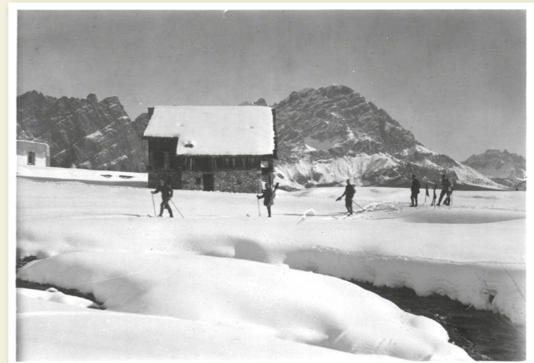
Archivio Print House