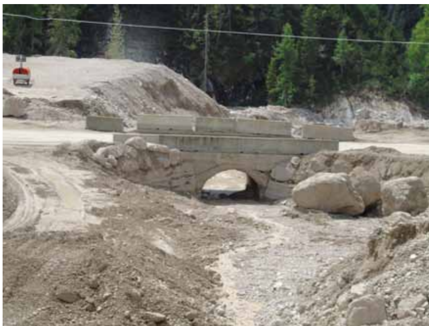
Vista del ponte sulla S.R. 48 da monte (9/8/2017).

La colata detritica si è innescata poco dopo la mezzanotte in seguito ad una precipitazione caratterizzata da diversi scrosci di notevole intensità. Il pluviometro del Dipartimento Territorio e Sistemi Agro-Forestali dell'Università di Padova posto sul Col da Varda sopra il Passo Tre Croci ad una quota di 2239 m s.l.m. ha registrato una precipitazione iniziata alle ore 00.05 e costituita prevalentemente da tre scrosci: il primo di 11 mm in 15 minuti, il secondo di 15 mm in 10 minuti ed il terzo di 14 mm in 15 minuti. Verosimilmente il primo scroscio è stato assorbito interamente o quasi dal terreno, mentre il secondo e maggiormente il terzo si sono trasformati prevalentemente in deflusso superficiale. Il secondo scroscio è quello che ha sicuramente innescato il fenomeno ed il terzo lo ha alimentato, aumentandone la magnitudo (intensità/ampiezza). A titolo di confronto, le colate del 22 agosto 2009 e 17 luglio 2015, che hanno causato minor distruzione, sono state innescate da un unico scroscio di durate 15 e 10 minuti rispettivamente. Nella zona non si sono registrati altri eventi tranne che sulla falda della Punta Nera, dove un fenomeno di colata ha interessato la parte alta del conoide. Le colate di detrito sono in genere causate da precipitazioni che presentano scrosci di notevole intensità e durate di 10-20 minuti. Le precipitazioni massime presentano infatti un'intensità